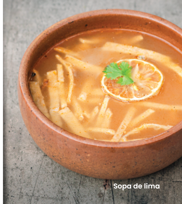
Sopa de lima

Trozitos de pechuga de pollo empanizado acompañado de papas a la francesa.