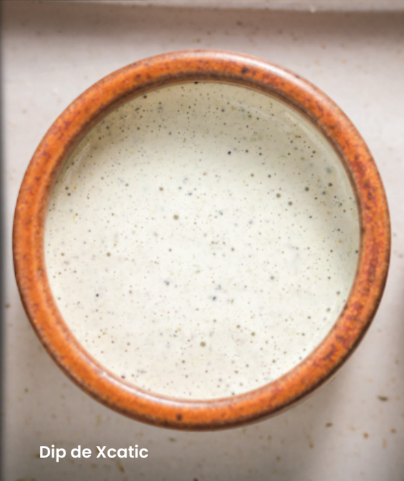
Dip de Xcatic