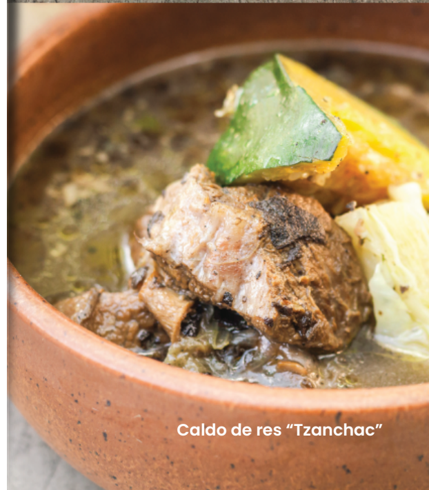
Caldo de res "Tzanchac"