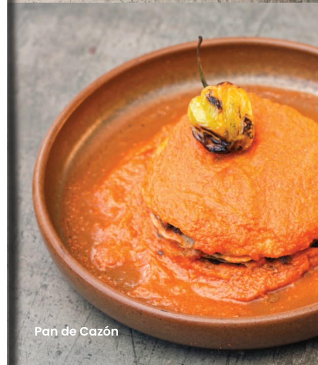
Pan de Cazón