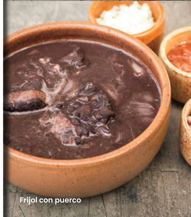
Frijol con puerco