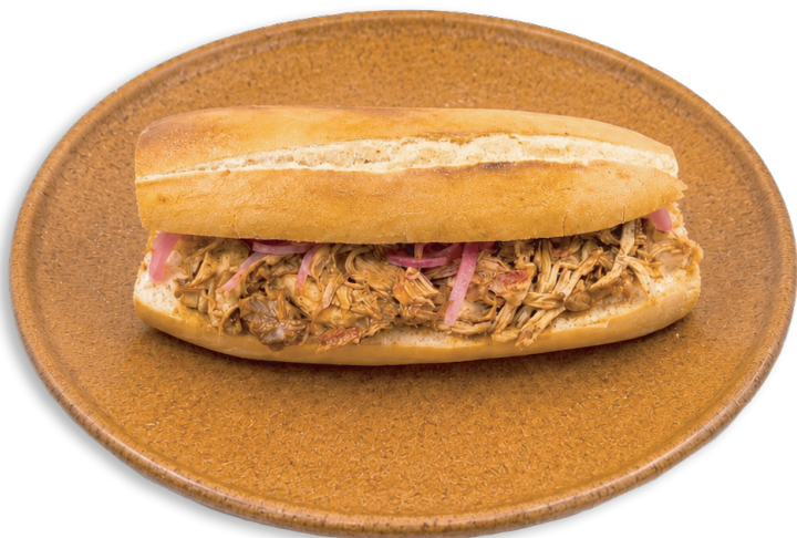
TORTA DE COCHINITA

QUESADILLA CON GUISO ..... $85 MNX Con tortilla fresca y queso de hebra.